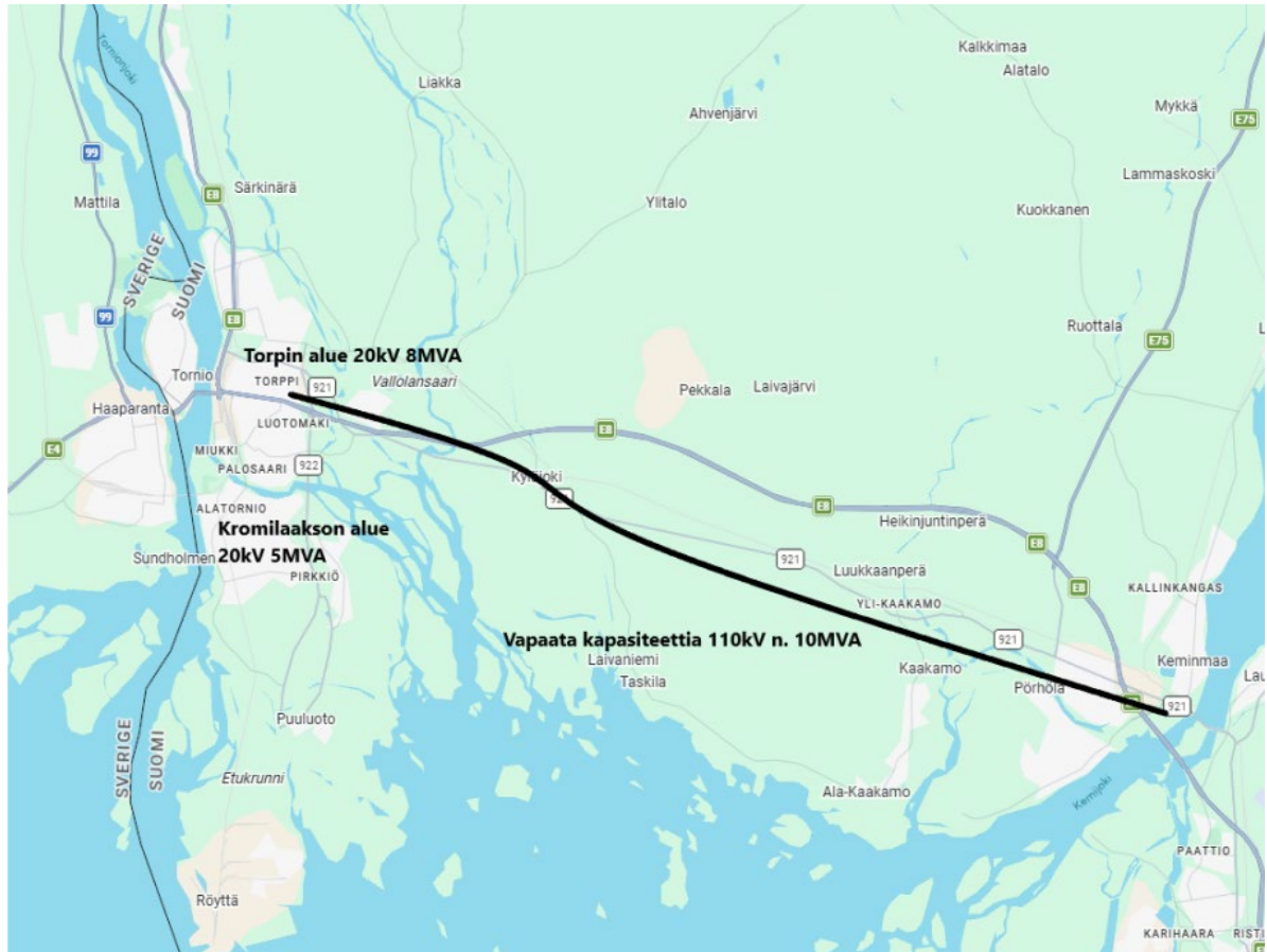
Kuva 1. Vapaata kapasiteettia.